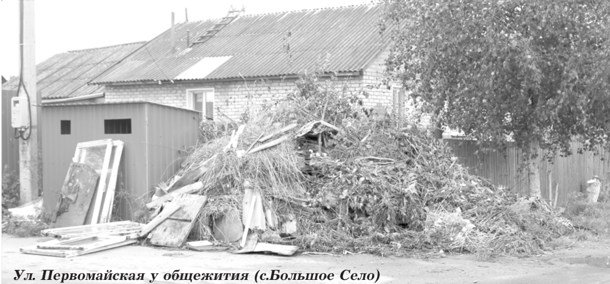
Ул. Первомайская у общежития (с.Большое Село)

Каждый год с наступлением осени самыми разными цветами в буквальном смысле слова, расцветают места складирования твердых бытовых отходов. Это наши старатели садоводы - огородники избавляются от еще недавно радовавшей глаз растительности. Чего только не увидишь в огромных «силосных» курганах: еще цветущие георгины, бархатцы, космею, ... плети от кабачков, огурцов, ботву моркови и свеклы и все это вперемежку с ветками деревьев, отслужившей свой век мебелью и всевозможным хламом.