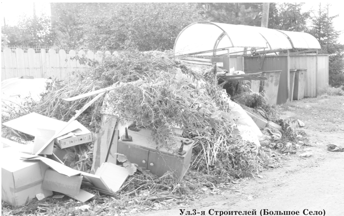
Ул.3-я Строителей (Большое Село)

нередко вывозят на обочины дорог, или просто высыпают за забор – лишь бы убрать из собственного сада. А потом возмущаются, что никто ничего